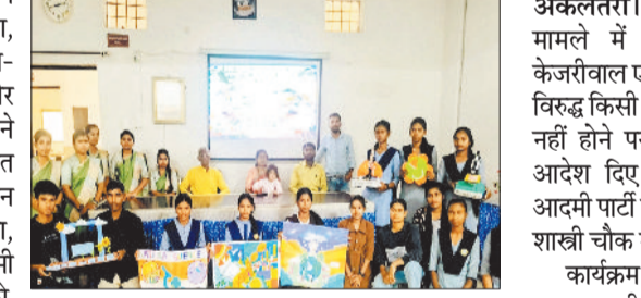
मॉडल के साथ छात्र छात्राएं।