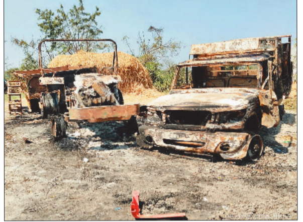
आग से जलकर खाक हुए वाहन।

मालखरौदा थाना क्षेत्र के गांव गोरखापाली में होली के दिन दो पक्षों में विवाद हो गया। विवाद के बाद दोनों पक्षों की ओर से जमकर मारपीट की गई। खूनी संघर्ष में कोटवार गंभीर रूप से घायल हुआ, जिसे बिलासपुर रेफर किया गया है। वहीं आक्रोशित लोगों ने बाइक, ट्रैक्टर, श्रेशर, डीजे पिकअप और घर को आग के हवाले कर दिया। मौके पर पहुंची पुलिस ने किसी तरह हालात पर काबू पाया। गांव को पुलिस छावनी में तब्दील कर दिया गया है।