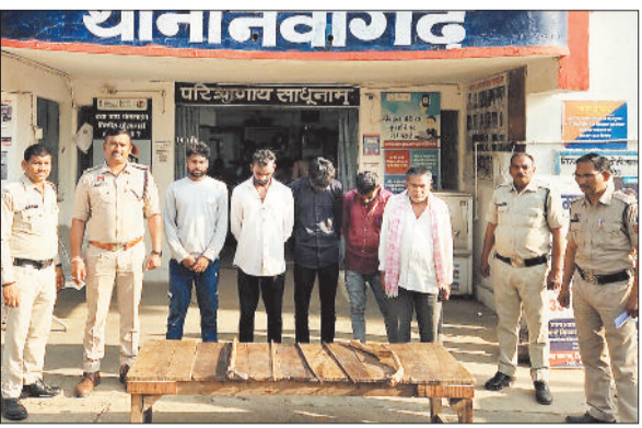
पुलिस के साथ गिरफ्तार आरोपी।