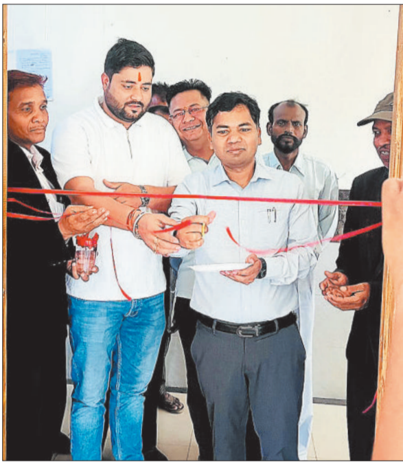
फीता काटकर लिंक कोर्ट का शुभारंभ करते अतिथि।

गौरतलब है कि बम्हनीडीह ब्लाक अंतर्गत 59 ग्राम पंचायत आते हैं। साथ ही ब्लाक की आबादी 1 लाख 80 हजार से अधिक है। बम्हनीडीह और आसपास के ग्रामीण क्षेत्रों के लोग अब तक अपनी राजस्व संबंधी समस्याओं को लेकर अनुविभागीय अधिकारी राजस्व से मिलने चांपा तहसील जाते थे कई ग्रामीणों को दूर-दराज के गांवों से घंटों का सफर तय करना पड़ता था, अब बम्हनीडीह में ही लिंक कोर्ट लगने से नामांतरण, बंटवारा, सीमांकन सहित अन्य राजस्व मामलों के निराकरण में सुविधा मिलेगी। स्थानीय स्तर पर