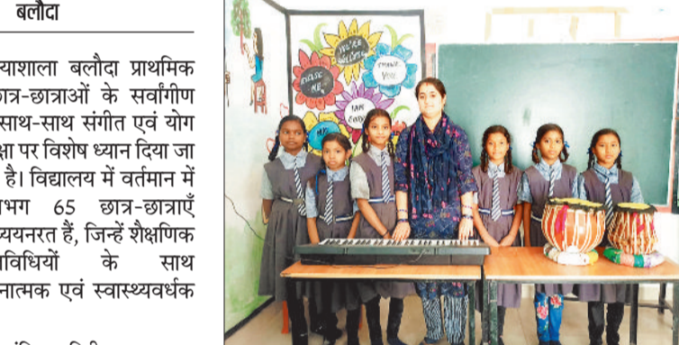
संगीत शिक्षा का अभ्यास करते छात्रा।

शासकीय (सरकारी) पीएमश्री कन्याशाला बलौदा प्राथमिक शाला में अध्ययनरत नौनिहाल छात्र-छात्राओं के सर्वांगीण विकास के लिए नियमित पढ़ाई के साथ-साथ संगीत एवं योग शिक्षा पर विशेष ध्यान दिया जा रहा है। विद्यालय में वर्तमान में लगभग 65 छात्र-छात्राएँ अध्ययनरत हैं, जिन्हें शैक्षणिक गतिविधियों के साथ रचनात्मक एवं स्वास्थ्यवर्धक