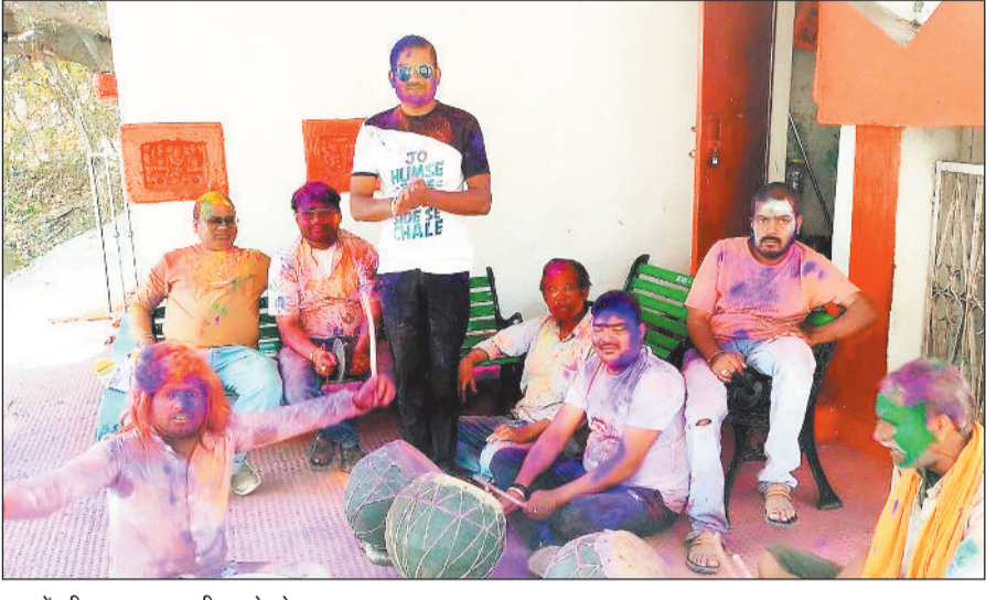
नगाड़ों की थाप पर फाग गीत गाते लोग।