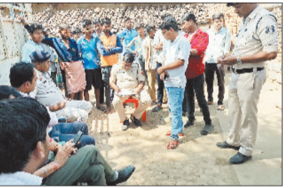
मामले की विवेचना करती पुलिस।